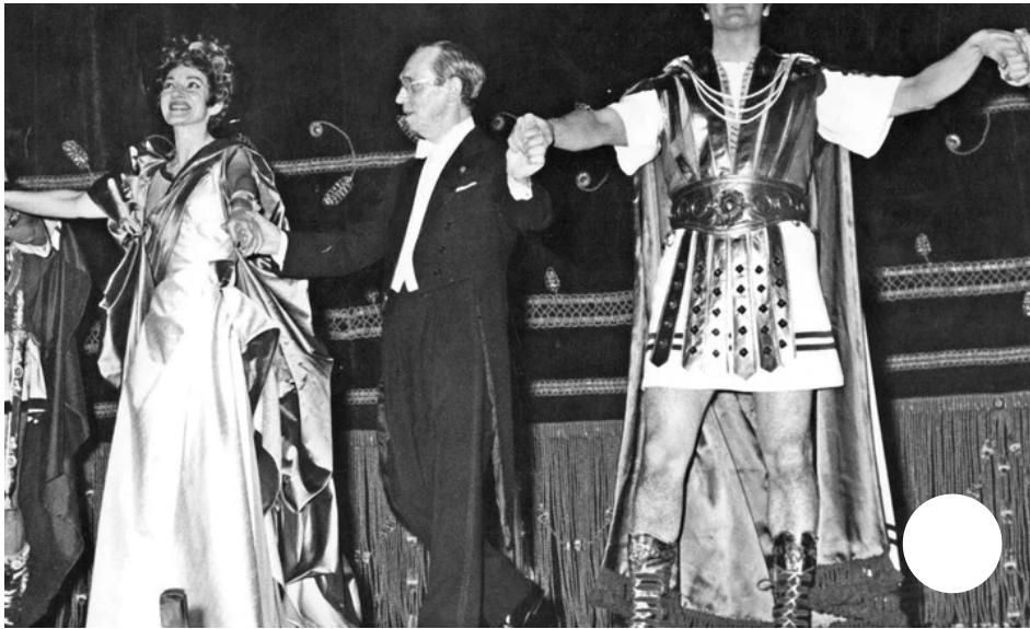
Franco Corelli, en el escenario de La Scala de Milán, junto a María Callas y el director Antonino Votto, en 1960.